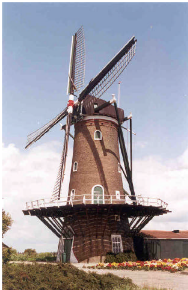
De Nijverheid van 1868