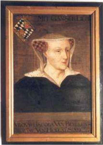
Paneel van Jacoba van Beieren (1400-1436), vrouw van Frank van Borsele, heer van Sint-Maartensdijk.