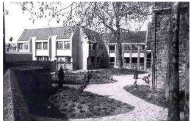
De tuin achter het monumentale stadhuis en de nieuwbouw.

17de eeuwse kopieën van schilderijen van M. van Mierevelt, P. Morreelse en G. Honthorst.