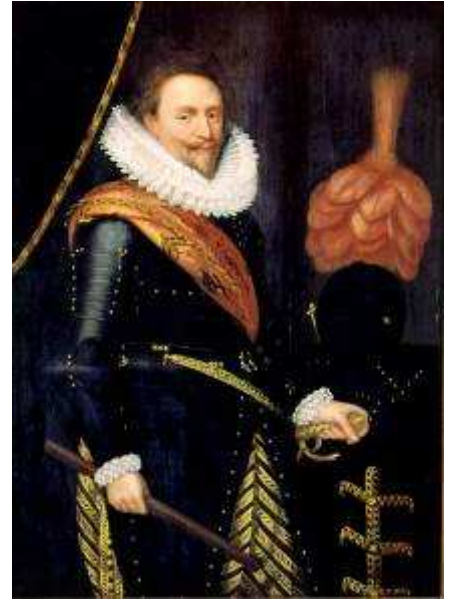
Prins Frederik Hendrik, heer van Sint-Maartensdijk, liet het stadhuis in 1628 verbouwen

staat verkeerd, werden bij het stadhuis getrokken. Reeds direct bij de aanvang van het werk in december 1960 bleek dat de gebouwen nog slechter waren dan men had gedacht. Verder werden achter de uniforme betimmering vondsten gedaan die het de architect mogelijk maakten de bouwperiodes nauwkeurig te bepalen. Het had tot gevolg dat de panden in hun oorspronkelijke toestand konden worden teruggebracht. Hoe ingrijpend deze restauratie is geweest blijkt ook uit de tijd die men er voor nodig had, bijna drie jaar.