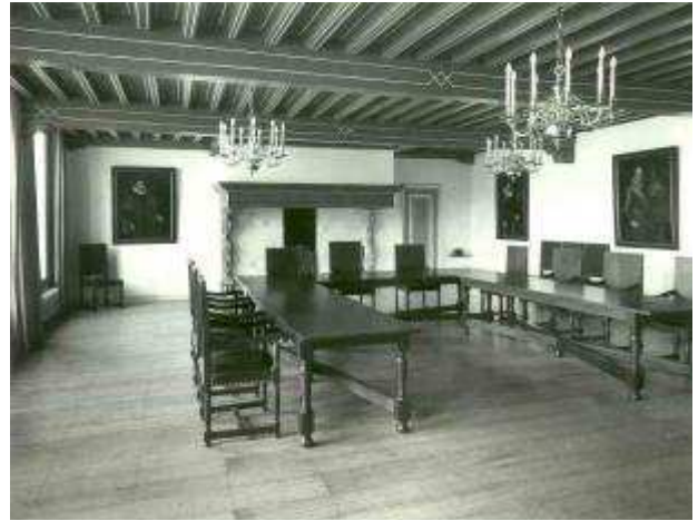
De raadzaal van de gemeente Tholen

Het stadhuis geniet landelijk belangstelling door de vijftien schilderijen van de Oranjes (één stelt een onbekende dame voor) en de panelen van Frank van Borssele en Jacoba van Beieren die in het gebouw hangen. Vermoedelijk zijn deze in de Franse tijd of in 1820 bij de afbraak van het kasteel van Sint-Maartensdijk, dat eeuwenlang eigendom van de Oranjes is geweest, naar het stadhuis overgebracht. Jacob van Lennep die met zijn vriend Dirk van Hogendorp in 1823 door Nederland trok en ook het eiland Tholen aandeed, vermeldde in zijn dagboek dat hij deze portretten in het stadhuis had gezien. In de twintiger jaren van deze eeuw wilde het gemeentebestuur ze verkopen, doch hier rees nogal wat verzet tegen van buiten de gemeente. De panelen zijn