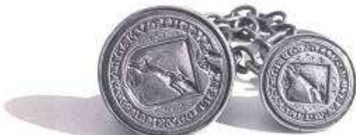
Zilveren stempelzegels van de smalstad (18 e eeuw)

Aan de hand van onder de kap teruggevonden sporen is de trapgevel gereconstrueerd. Op de wapenschilden in de voorgevel zijn de wapens aangebracht van de smalstad (een springende haas), de provincie Zeeland en prins Frederik Hendrik. Laatstgenoemd wapen is identiek aan dat van zijn halfbroer Philips Willem dat op twee brandemmers van 1615 en 1616 is afgebeeld. Deze leren brandemmers zijn tijdens de restauratie in een dichtgetimmerde schoorsteen in het hoofdgebouw gevonden. Vermoedelijk zijn deze bij de verbouwing van 1628 hierin geraakt. Bij het bouwkundig onderzoek dat aan de restauratie vooraf ging, bleek ook dat de opkamer van het hoofdgebouw (voor 1971 raadszaal) omstreeks 1620 van sloopmateriaal was gebouwd. Tijdens de restauratie is in deze huidige ontvangkamer weer een schouw aangebracht. Het 18de eeuwse schoorsteenstuk is afkomstig van het voormalige paleis Kneuterdijk te 's-Gravenhage. Het eveneens 18de eeuwse linnen behang in deze kamer is gevonden in een woning te Stavenisse.