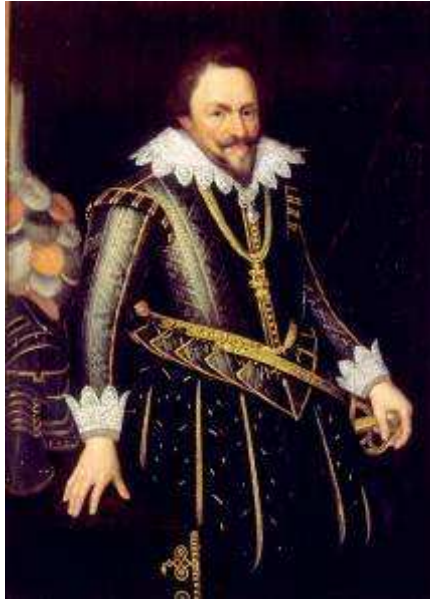
Prins Philips Willem van Oranje, heer van Sint-Maartensdijk.